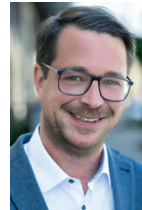
Maximilian Platzer Erster Bürgermeister Gemeinde Gauting