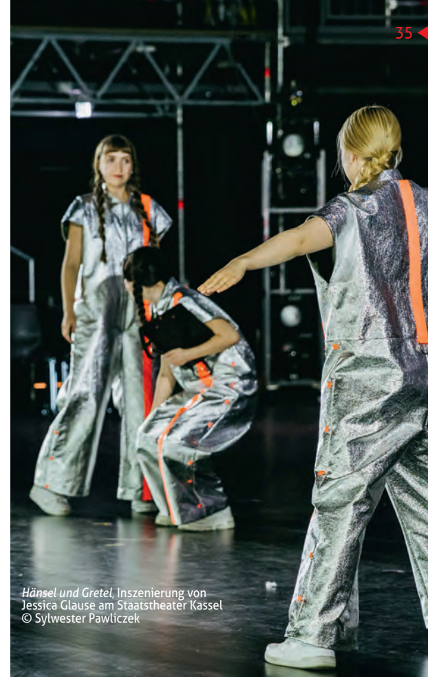
Hänsel und Gretel , Inszenierung von Jessica Glause am Staatstheater Kassel